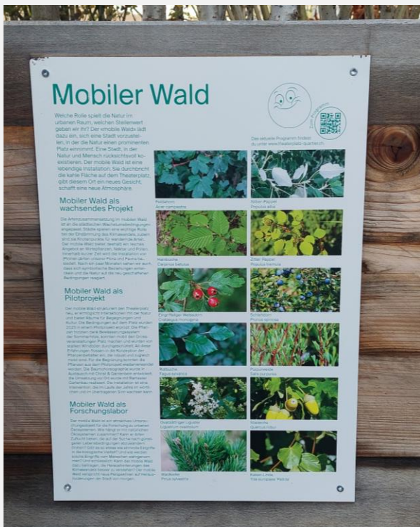
Standort Theaterplatz, 08.12.2024

( https://theaterplatz-quartier.ch/#wald , Stand: 19.11.2024)