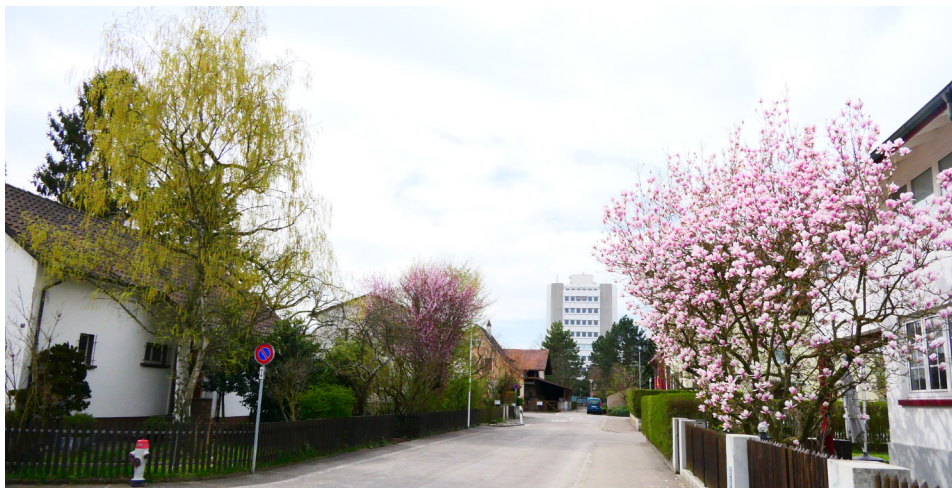
Quartierstrasse Lange Heid mit dem nahe gelegenen Zentrum Gartenstadt

Vielen Dank für das Gespräch und Ihr Vertrauen.