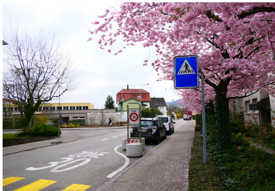
Zone 30 in der Bottmingerstrasse

Was sie allerdings ärgert, ist der Verpackungsmüll, der achtlos von vielen Besuchern des Schnellrestaurants an der Ecke Bruderholz- / Reinacherstrasse weggeworfen wird. Und der dichte Verkehr auf der Bottmingerstrasse. «Hier fahren so viele Autos und Lastwagen durch. Die Einführung der 30iger Zone ist noch zu wenig effektiv, da der schadhafte Strassenbelag Lärm verursacht.