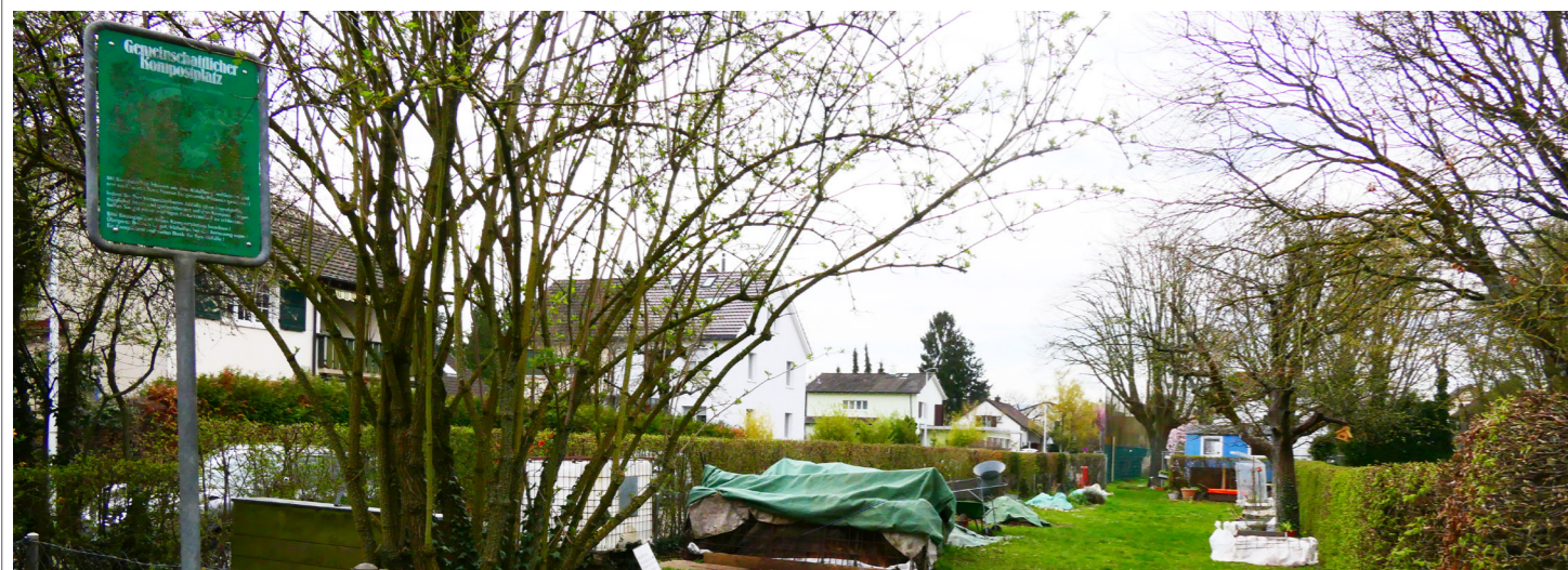
Kompostplatz Lange Heid