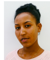
Mehret Gebreyesus Eritrea