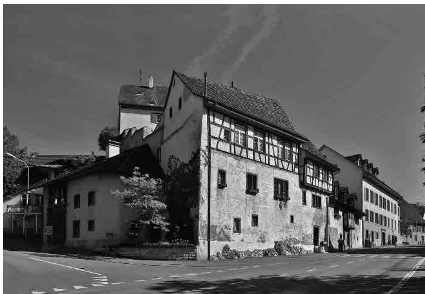
23 Marinhaus, um 1550