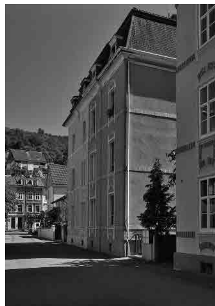
30 Kosthäuser, 1901