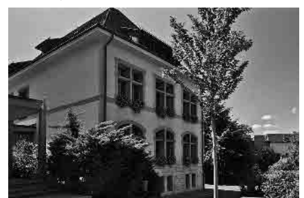
18 Schulhaus Löffelmatt