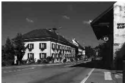
1 Altes Gemeindehaus

Gemeinde Münchenstein, Bezirk Arlesheim, Kanton Basel-Landschaft