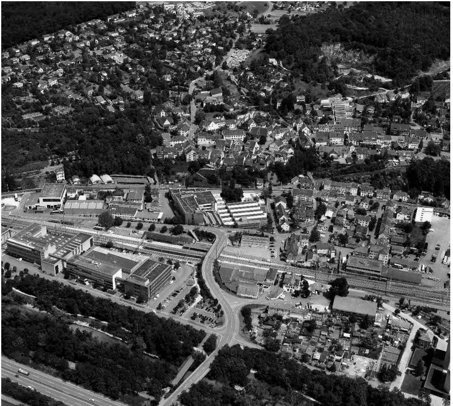
Flugbild Bruno Pellandini 2006, © BAK, Bern

Kompakte mittelalterliche Ortsanlage am Fuss der Burgruine und schlossartiger Landsitz im weiten Siedlungsband des Birstals. Städtisch anmutendes Bahnhofsviertel und ausgedehnte, nach der Eröffnung der Jurabahn entstandene Industrieareale in der Flussebene.