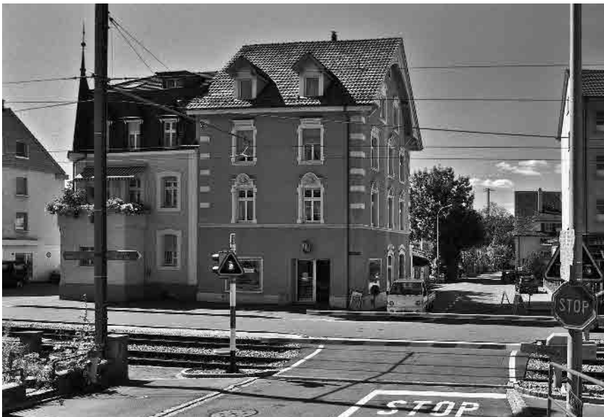
26 Im Gstad

Gemeinde Münchenstein, Bezirk Arlesheim, Kanton Basel-Landschaft