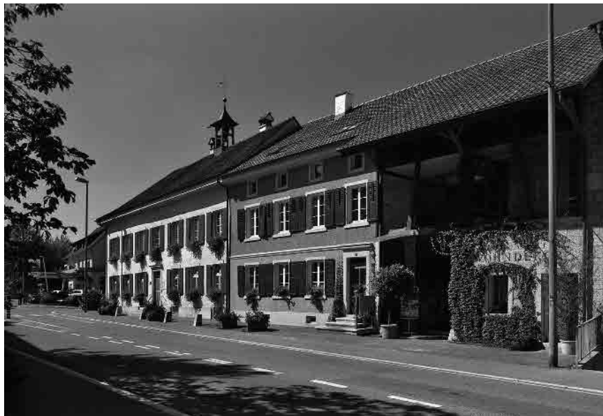
3 Südliche Vorstadt