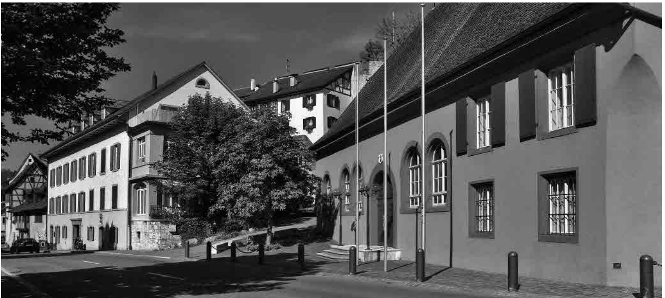
11 Ehem. Zehntentrotte am Dorfplatz