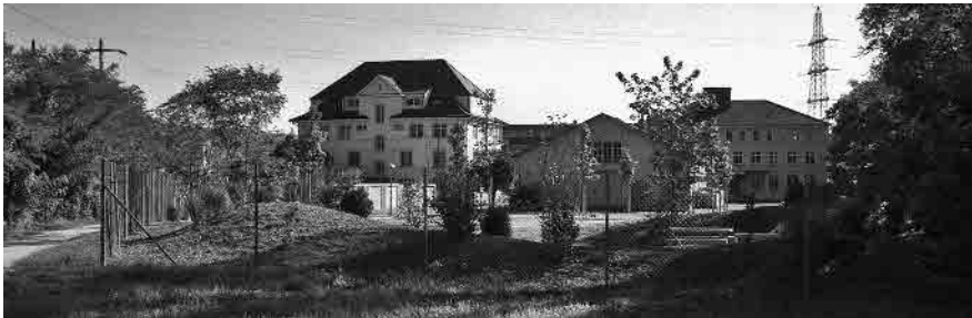
33 Elektra Birseck