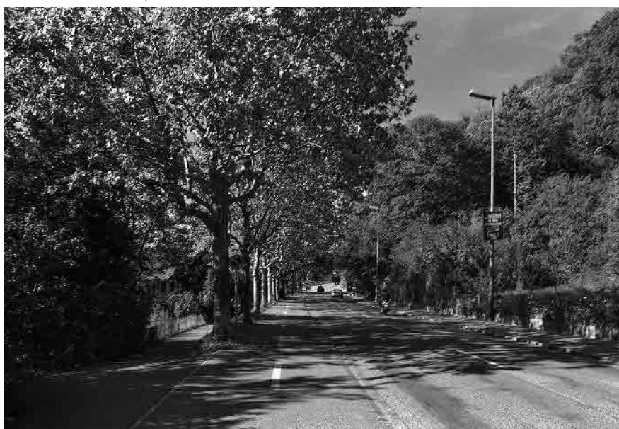
25 Hauptstrasse zum Bruckgut