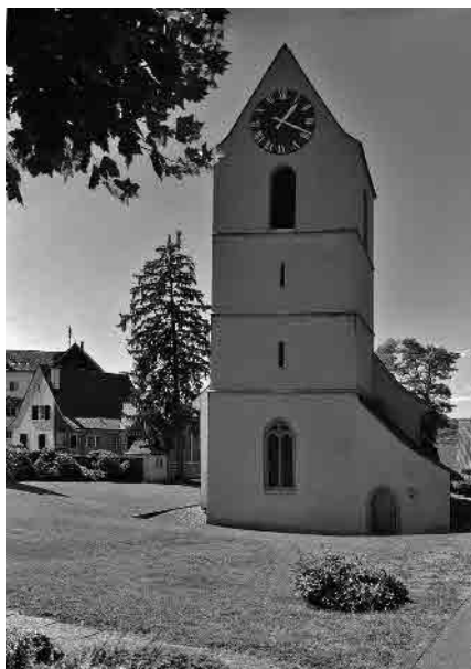
19 Pfarrkirche, A. 15. Jh.