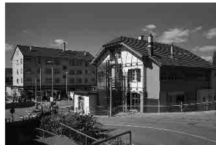
27 Station der Birstalbahn