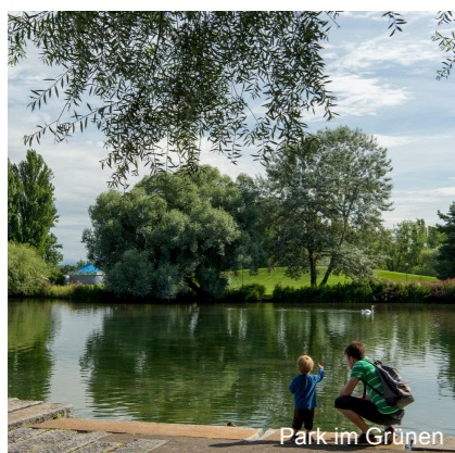
Park im Grünen

Die neuen ‚Zonenvorschriften Siedlung‘ ermöglichen die Nutzung innerer Reserven in Wohnquartieren. Potenzialflächen die für die Entwicklung der Gemeinde wichtig sind - wie zum Beispiel das Zentrum Gartenstadt - werden im Siedlungsgebiet mittels Quartierplanungen optimal genutzt und gestärkt. Wir setzen städtebauliche Akzente, welche das Gesicht der Gemeinde Münchenstein als dynamischen und attraktiven Wohn- und Arbeitsort prägen.