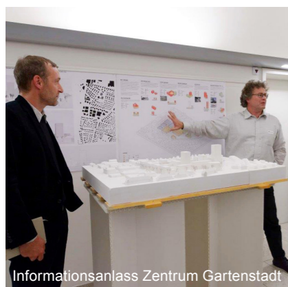
Informationsanlass Zentrum Gartenstadt

Münchenstein lebt eine Kultur der gegenseitigen Wertschätzung. Durch die offene und transparente Kommunikation schaffen wir Vertrauen und ein breites Verständnis für Veränderungen. Wir nehmen Kritik aktiv auf und integrieren sie in den Meinungsbildungsprozess. Im offenen Dialog stärken wir die Akzeptanz der Bevölkerung für laufende Entwicklungen.