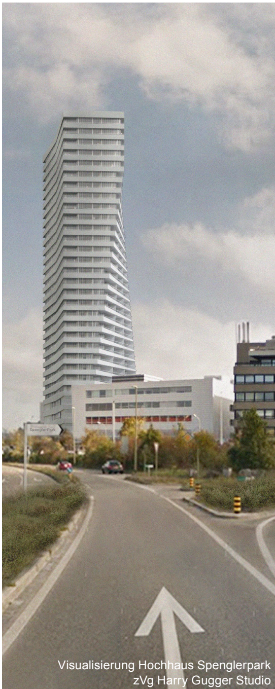
Visualisierung Hochhaus Spenglerpark